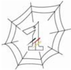
Mensch zuerst - Netzwerk People First Deutschland e. V.