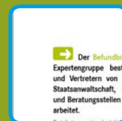
Schulungs und Informationsordner